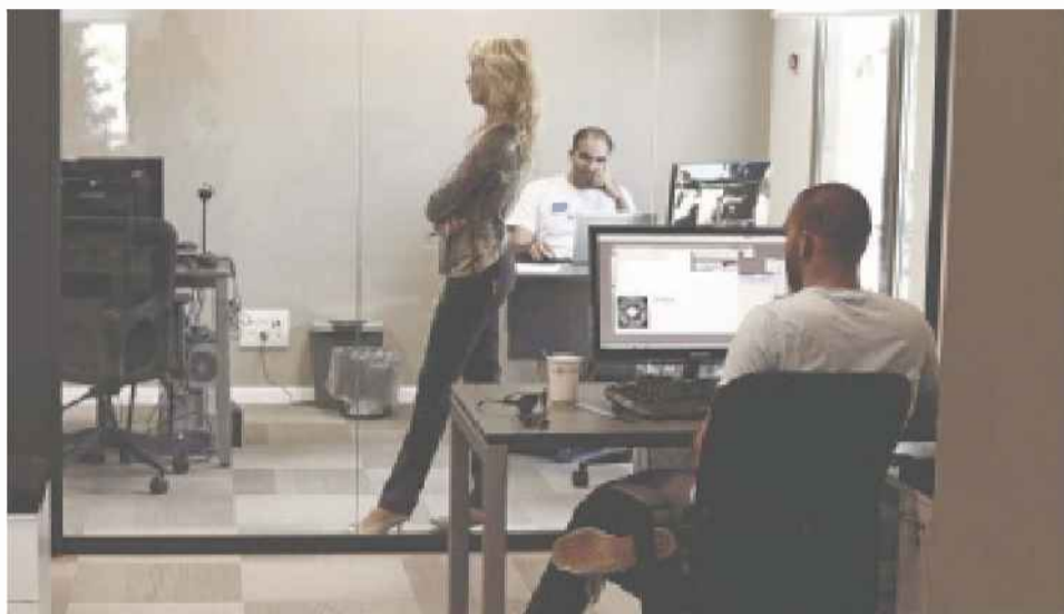
הביקוש למפתחי אינטרנט עלה ב-14% ושכרם עלה ב-6%

לאחר שנתיים של עליות בשכר ובגיוס עובדים, הגיעה 2012 ושינתה המגמה. תעשיית השבבים מובילה את הירידה בגיוסים, ומנגד חלה עלייה בביקוש למתכנתי מובייל ואינטרנט. בחברות ההשמה מסבירים: "מתפתח שוק של מעסיקים - יש יותר מועמדים ממשורות"